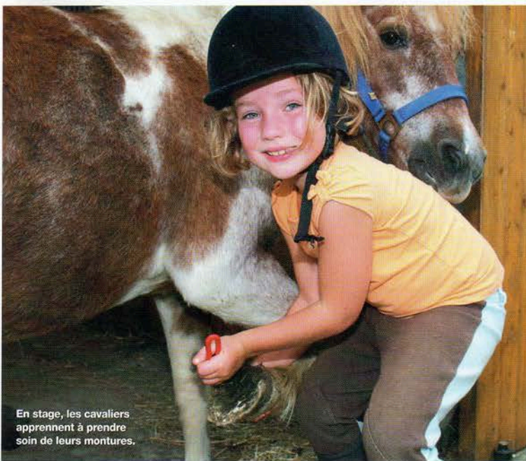
En stage, les cavaliers apprennent à prendre soin de leurs montures.

Les congés estivaux approchent à grands pas. Il est l'heure de songer au programme des vacances, et pourquoi pas de s'inscrire à un stage d'équitation ? Dans ce domaine, l'offre est extrêmement large. Avant de partir à la recherche du stage idéal, définissez vos objectifs et vos envies, et sachez déterminer votre niveau. Stage à thème, stage compétition, stage linguistique, stage nature, les formules se déclinent à l'infini. Petits et grands sont concernés. Débutants et confirmés peuvent tous trouver le stage qui leur convient. Voici quelques unes des possibilités qui s'offrent aux cavaliers désireux de conjuguer leurs congés avec l'équitation.