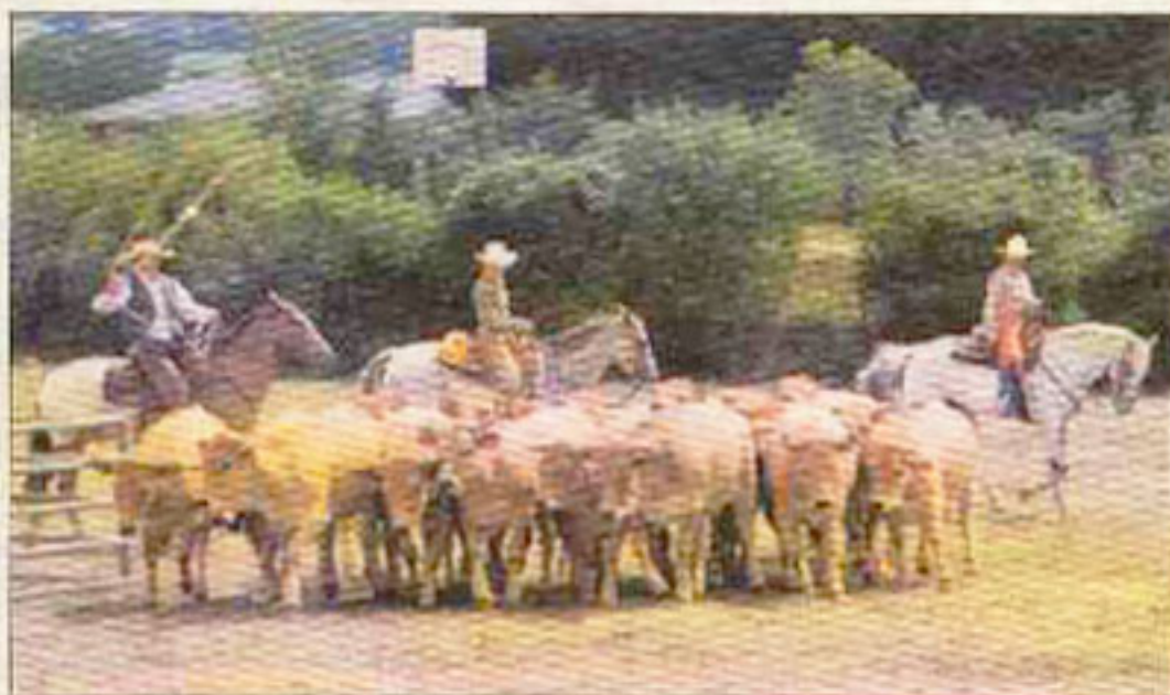
Le Comtal avait hier des allures des grands espaces Américains. LE

Les enfants ont, pour leur part, participé à des jeux, monter sur des poneys, ou encore se sont exercés au dressage avec des brebis en lieu et place des vaches. Un moment convivial qui a enchanté petits et grands. Il était d'ailleurs possible de se rendre compte du succès de