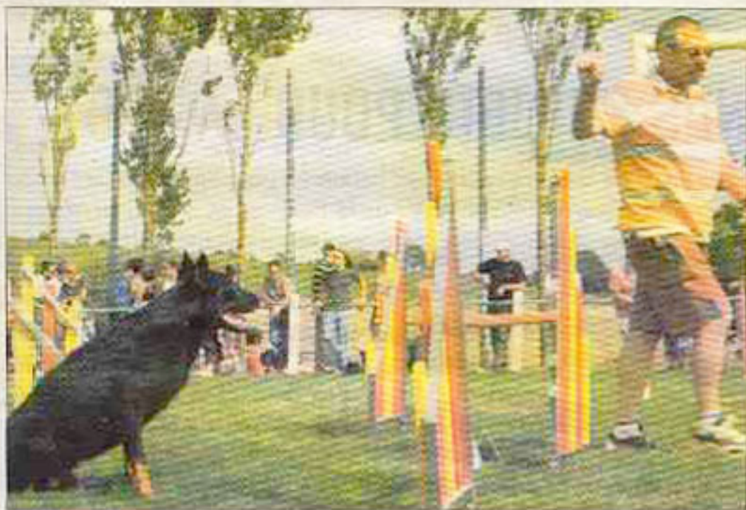
Des éleveurs ont montré la qualité de leurs chiens à l'agility. LE

Le championnat de France de chiens de troupeaux c'est bien, le rodéo c'est exotique, mais il y avait aussi hier au programme de l'agility.