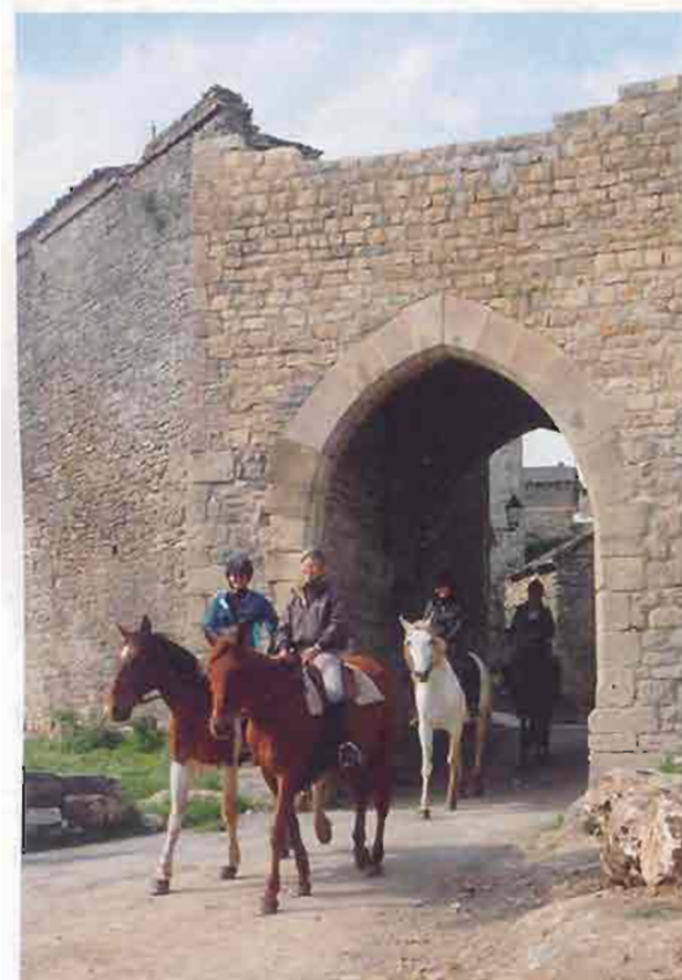
L'une des portes du village de La-Couvertouirade, fondation templière et commanderie hospitalière du Larzac, P. Miriski

sur 1400 hectares, le Domaine de Gaillac, dirigé par la famille Arnal, a des capacités d'hébergement importantes : 4 chambres, 1 studio et des dortoirs à n'en plus finir, de quoi loger près de 150 personnes !